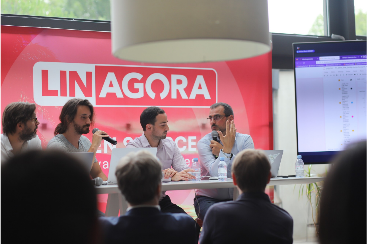
Meet-up Communauté Open LLM France – 28 juin 2023 – Villa Good Tech

LINAGORA Villa Good Tech 37 Rue Pierre Poli 92130 Issy-les-Moulineaux www.linagora.com